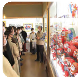
群馬の伝統文化に触れる