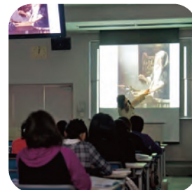
芸術へいざなう・語る