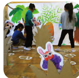
保育所でのワークショップ