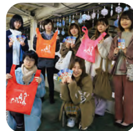
スケートセンターとのコラボ