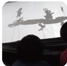
小学校での影絵芝居