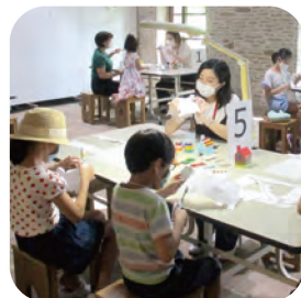
美術館でのワークショップ