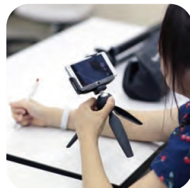
ビデオアート (撮影風景)