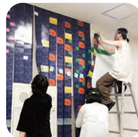
病院内モザイクアート