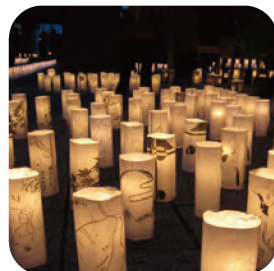
玉村八幡宮・燈籠宵まつり